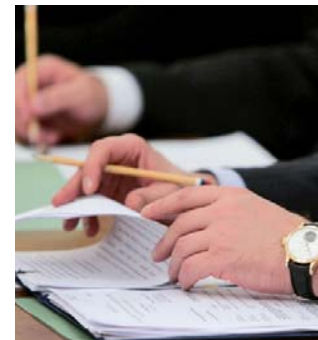
По материалам центральных СМИ.

В Госдуму внесен проект нового закона о нотариате. Согласно документу, нотариальные тарифы будет определять правительство. А нотариус будет отвечать за свои действия, а также за вред, причиненный его сотрудниками. То есть возмещать причиненные потерпевшему убытки или компенсировать моральный вред, например, в случае разглашения личной тайны.