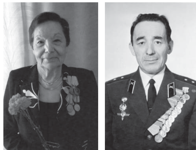
Опыт, мудрость, заслуги.