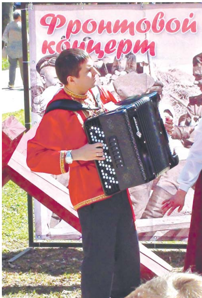
Окончание. Начало на 1 стр.