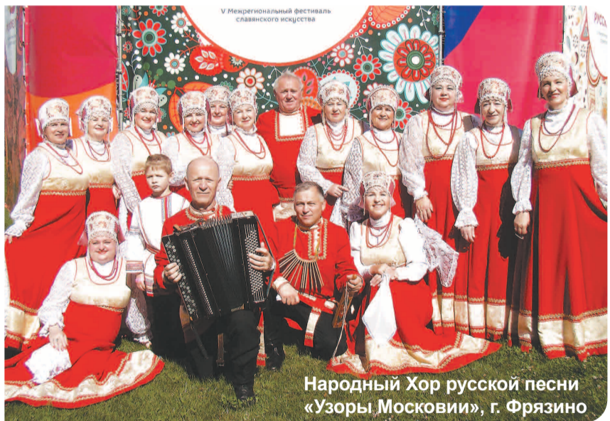
Народный Хор русской песни «Узоры Московии», г. Фрязино

Счастливого пути вам и успешных выступлений на песенных конкурсах!