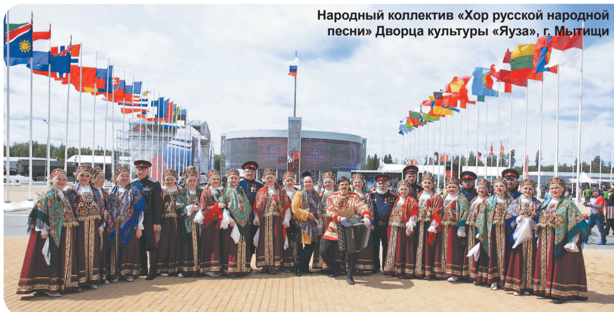
Народный коллектив «Хор русской народной песни» Дворца культуры «Яуза», г. Мытищи