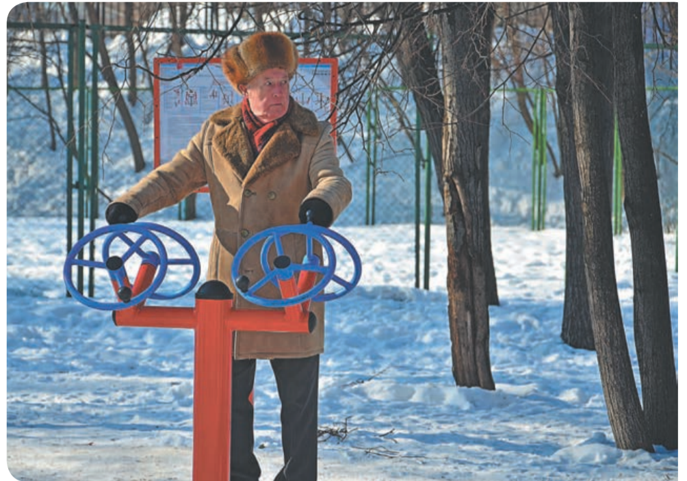
Теперь и зимой, и летом на новых спортивных площадках можно увидеть пенсионеров. Когда есть где заниматься, погода уже не помеха!

Не должно отставать и Подмосковье! Новые уличные тренажёры, специально созданные для пенсионеров и людей с ограниченными возможностями, обязательно будут востребованы. И общественное движение «Вера и Спорт», безусловно, при поддержке единомышленников и просто неравнодушных людей постарается сделать всё, чтобы такие важные проекты были успешно реализованы в Московской области.